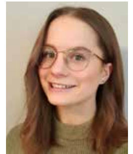
29 Kral Eva, Abt. III