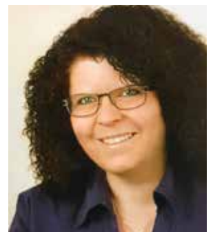
9 Raith Renate, Abt. I